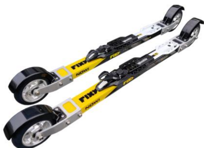
FIXY Fiberglass Skate 1995 kr