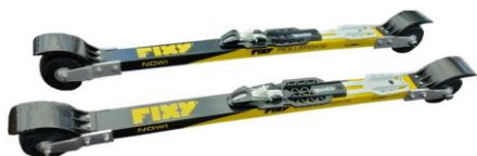
FIXY Fiberglass Classic 1995 kr