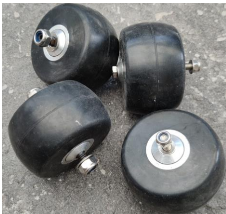
Rullskidhjul klassiska 4 pack komplett 75x44 mm Passar flera märken 1, 2,3 och 4:or 895 kr