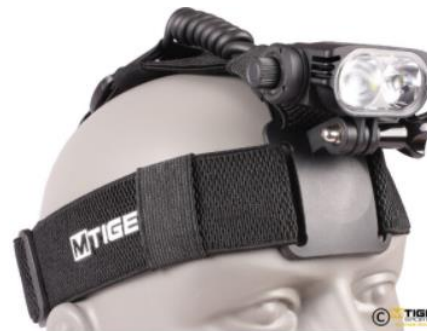
Pannlampa X10 Evo-II Laddbar 1000 lumen 1495 kr