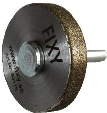
FIXY Stavspetsslipen 895 kr