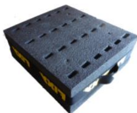
FIXY Kuben Rymmer 24 par längdskidor 1495 kr

Vi säljer Peltonen SkiTrab och Yoko SOMMARFYND ! Massor av klassiska tävlingskidor Oneway och SkiTrab tidigare årsmodeller utförsäljes 1995 kr