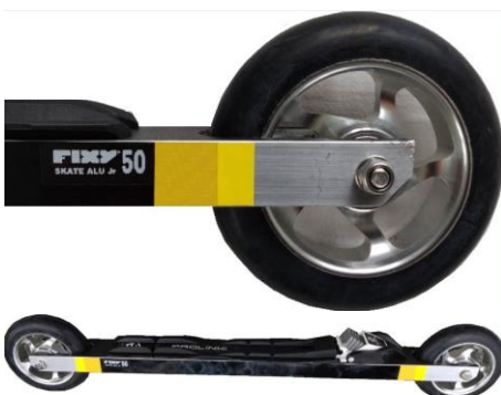
FIXY alu JR 50/55 1495 kr