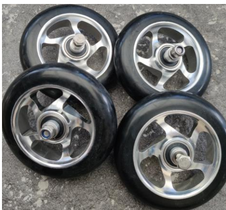
Rullskidhjul skate 4 pack komplett 100x25 mm Passar flera märken 1, 2,3 och 4:or 795 kr